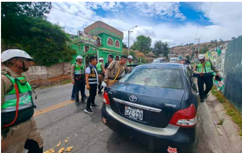
Durante operativo antidrogas en la vía Libertadores.