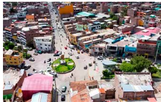
Recesión económica que atraviesa el país.

➤Refieren que en la actualidad se tienen pocas oportunidades laborales.