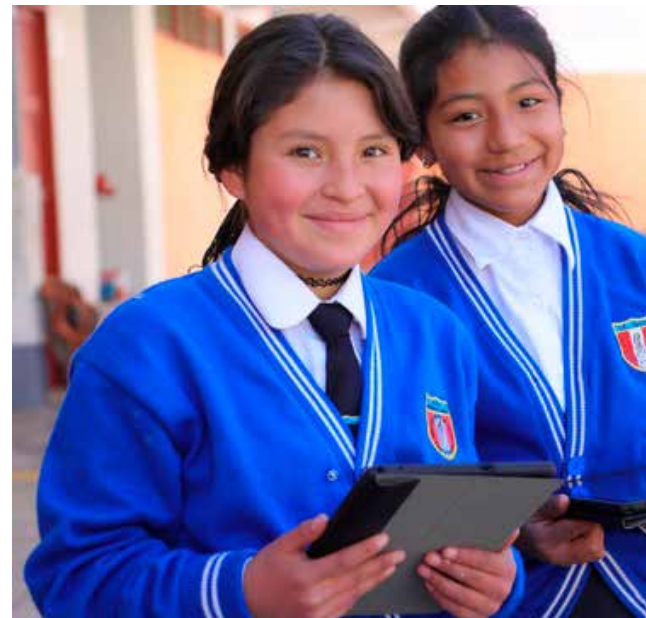
En la reducción de brechas sociales, educación.

En tanto, acotó que la sequía junto a la escasez hídrica afectará la seguridad alimentaria, por lo que solicitó al ente regional a dar mayor interés a este tema, en coordinación con los dirigentes agrarios.