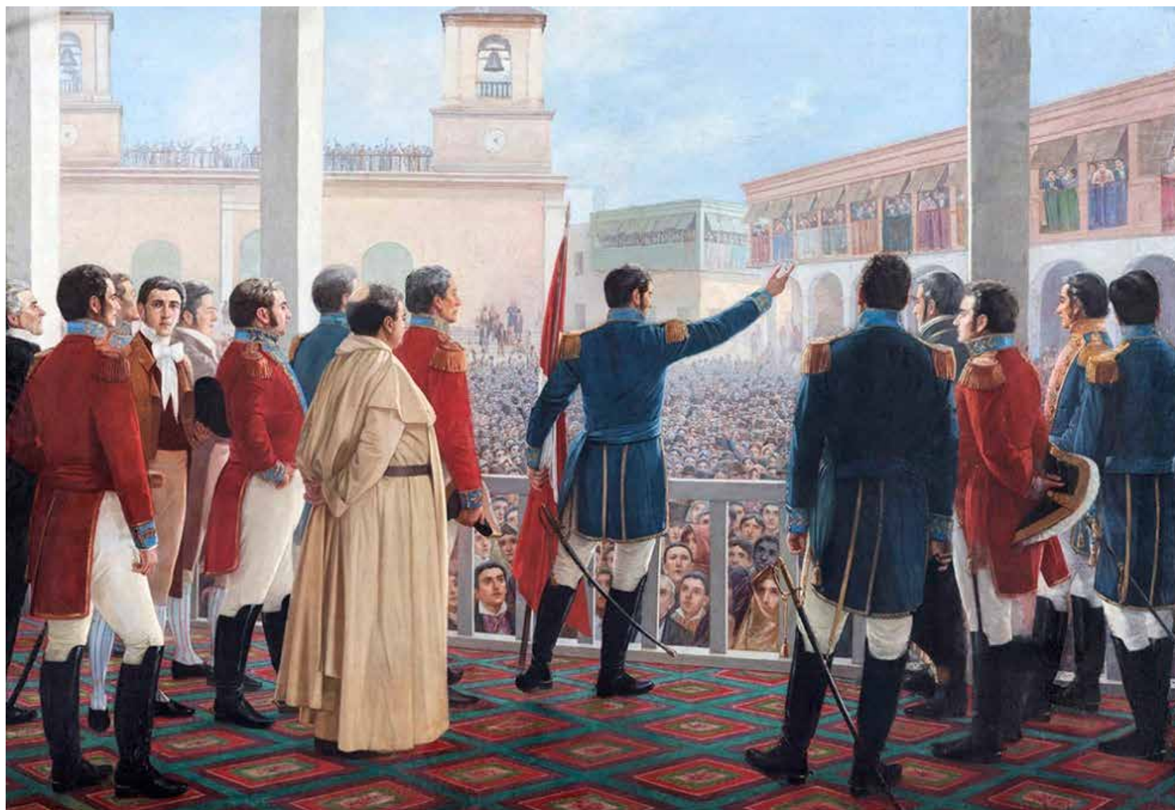
La proclamación de la Independencia, 1904. Juan Lepiani (Lima, 1864 - Roma, 1932). Óleo sobre tela, 274 x 397 cm. Museo Nacional de Arqueología, Antropología e Historia del Perú. Ministerio de Cultura del Perú. Es la imagen más conocida de la Independencia del Perú, que no refleja realmente el proceso de la independencia y se limita, con muchos errores a un solo hecho: la proclamación por San Martín el 28 de julio de 1821.

En entrevista en mayo del 2013, para Ideele Revista N° 229, Cecilia Méndez señaló aseguró que “Velasco no ha sido olvidado; su presencia se manifiesta como un silencio, como un miedo. Lo que pasa es que muchas