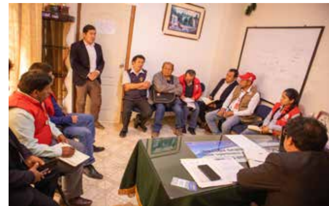
> Trabajo de inspección de campo.

>Consejeros se reunieron con responsables y supervisaron los trabajos de la obra