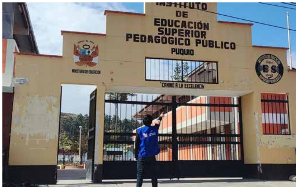
En el Instituto de Educación Superior Pedagógico Público de Puquio.

El pedido fue hecho tras una visita a la sede