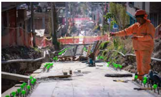
> Obra es ejecutada por el Consorcio Álamos.

Vecinos del sector Los Olivos, en el distrito de San Juan Bautista, mostraron su malestar por los trabajos de la obra de drenaje para encauzar un riachuelo en la zona, debido a que los ejecutores de la obra, el Consorcio Álamos, acumulan desmonte en la calzada de la pista, lo que atrae polvo y, en época de lluvia, inunda la losa de portiva.