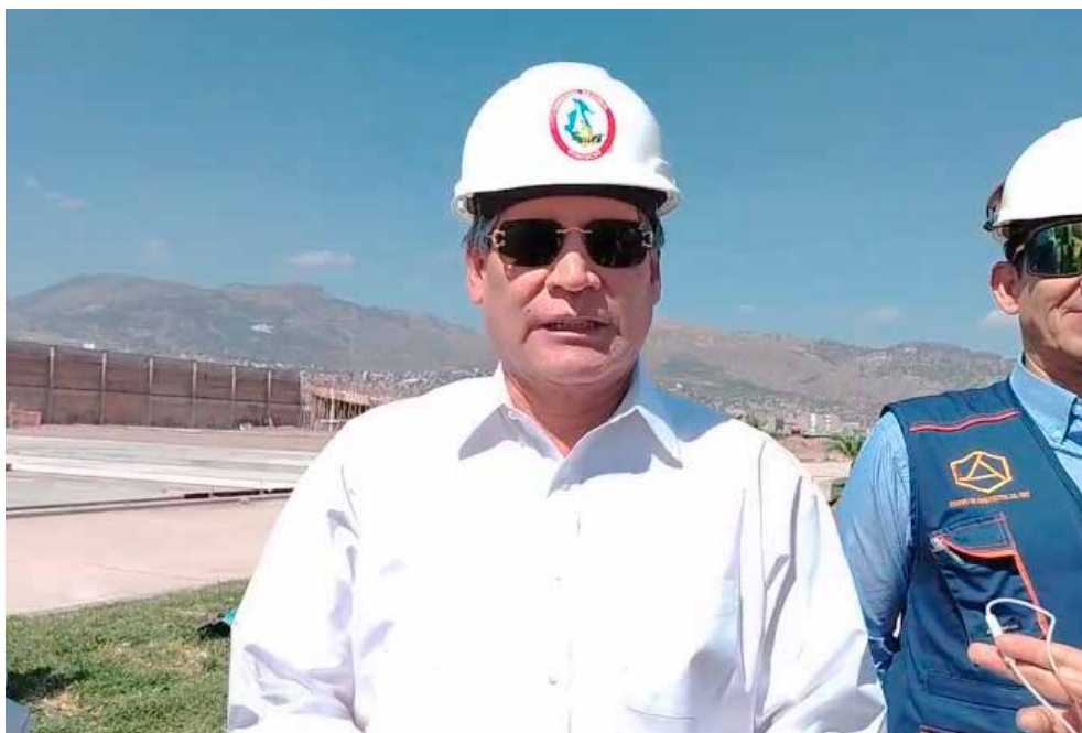
> Gobernador regional de Ayacucho, pidió acción del contralor general.

Según el informe de Control N.º 087-2024-OCI, la zona donde se construye el estacionamiento, ubicada en la parte frontal del predio, es propiedad del Ministerio de Transportes y Comunicaciones (MTC), lo que genera una discrepancia con el expediente técnico aprobado y podría resultar en un perjuicio para el Gobierno Regional de