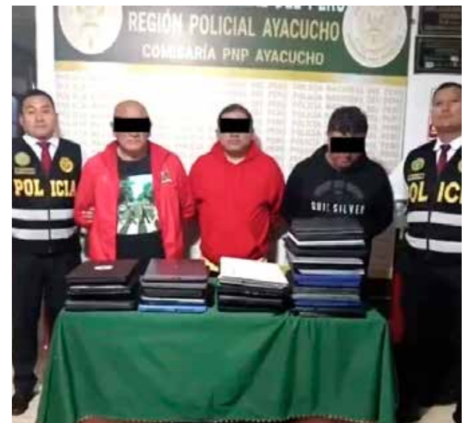
Fueron puestos a disposición de las autoridades.

También no se descarta que la mercadería sea producto de contrabando, motivo por el cual la policía en coordinación el Ministerio Público procedió con su incautación.