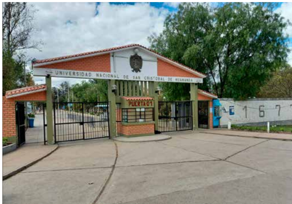
RESULTADO DE LAS ELECCIONES PARA RECTOR Y VICERECTORES